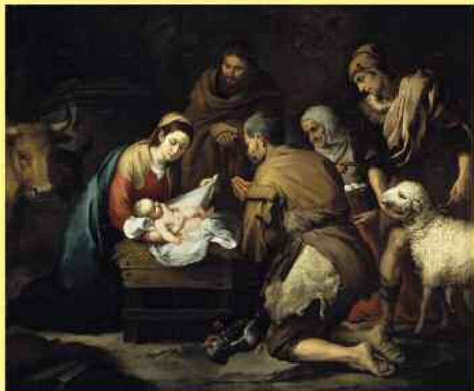
Bartolomé Estéban Murillo. Adoración de los Pastores: 1668

Parroquia de Nuestra Señora del Perpetuo Socorro Avda. de Goya, nº 7, 50006 ZARAGOZA - Telf.: 976 274 781